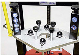
Bloklama Plakası Blocking Plate