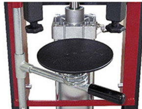
Destek Diski Movable Plate